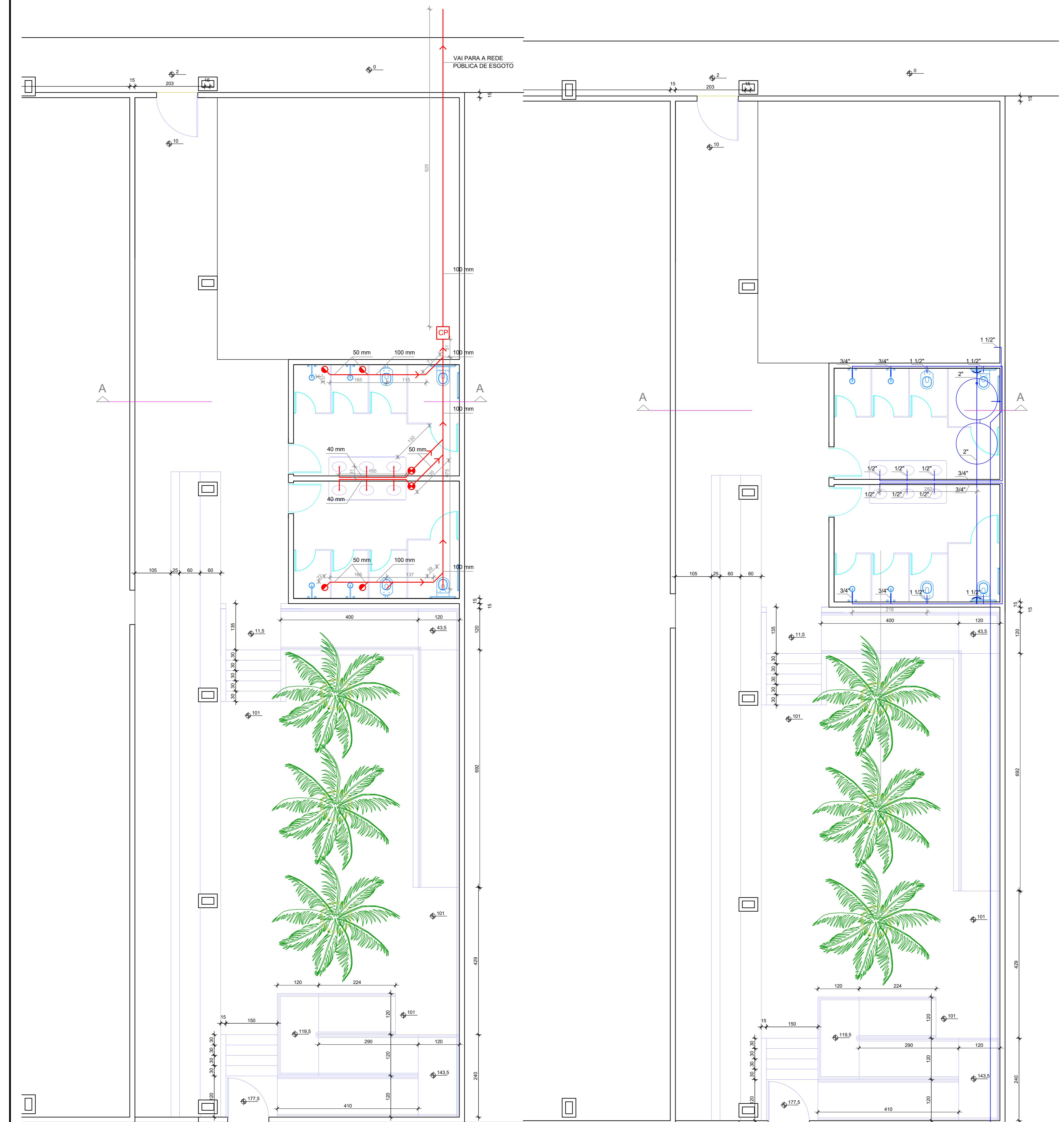
PLANTA BAIXA - REDE DE ESGOTO ESC: 1/50